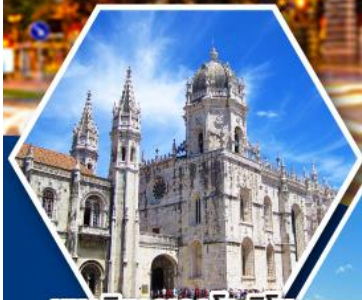
มหาวิหารเจอรันโบ