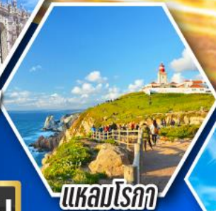
แหลมโรคา