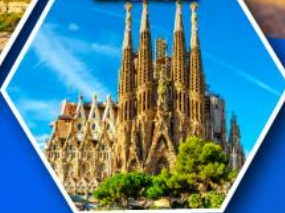
โบสถ์ซากราดา แฟมิเลีย